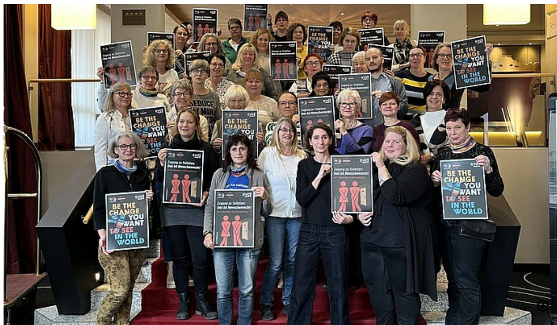
Aktion auf der Sitzung der EVG-Bundesfrauenleitung

Am 19. November ist „World Toilet Day“ („Welttoilettag“). Seit mehr als 20 Jahren macht dieser internationale Aktionstag auf das Recht auf menschenwürdige und nicht gesundheitsschädigende sanitäre Bedingungen aufmerksam.