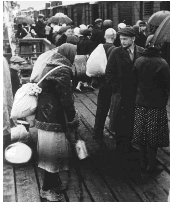
Eisenbahntransporte mit Menschen: In die Evakuierung, Konzentrationslager oder in den Tod. (Bild: Bundesarchiv, Bild 183-B25-447, Aufnahme vom 1. Juni 1942, Foto: Rabenberger)

Im Gegenzug hielten die Nazis für die Gewerkschaften ein vergiftetes Geschenk bereit. Den 1. Mai, seit Ende des 19. Jahrhunderts bereits Kampftag der Arbeiter:innen, erklärten die Nazis zum gesetzlichen Feiertag, als „Tag der Nationalen Arbeit“. Den zelebrierten sie unter anderem mit einer wuchtigen Feier inklusive Lichtschau auf dem Reichssportfeld in Berlin. In dieser schlummerte bereits das Unheil. Propagandaminister Joseph Goebbels notierte in seinem Tagebuch: „Morgen werden wir nun die Gewerkschaftshäuser besetzen, Widerstand ist nirgends zu erwarten.“ Mit der Zerschlagung der freien Gewerkschaften begann für viele Arbeiterinnen und Arbeiter, die sich gewerkschaftlich engagierten, eine Zeit des Leidens. Viele von ihnen wurden verfolgt, in Zuchthäuser oder die allmählich entstehenden Konzentrationslager gebracht und dort misshandelt, gefoltert oder gar ermordet.